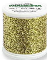
Metallic No. 25 4 Farben in 40 m 100% metallis. Polyester