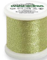
Metallic No. 15 4 Farben in 100 m 60% Polyester 40% metallis. Polyester