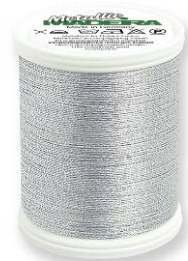
Metallic No. 15 4 Farben in 300 m 60% Polyester 40% metallis. Polyester