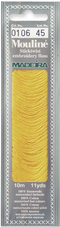
Mouline 379 Farben in 10 m