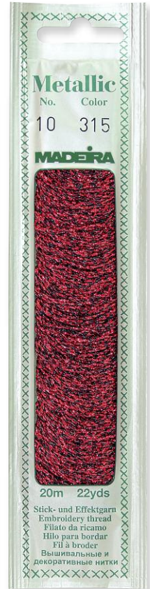
Metallic Perlé No. 10 24 Farben in 20 m 40% Polyamid 60% metallis. Polyester