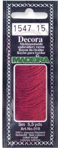
Decora 90 Farben in 5 m