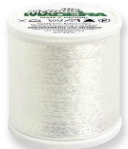
Metallic No. 120 18 Farben in 1.000 m 45% Polyamid 55% metallis. Polyester