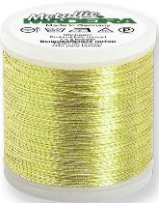
Metallic No. 6 2 Farben in 50 m 75% Viskose 25% metallis. Polyester