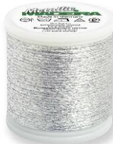
Metallic No. 20 2 Farben in 50 m 45% Polyamid 55% metallis. Polyester