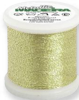
Metallic No. 12 8 Farben in 40 m 70% Viskose 30% metallis. Polyester