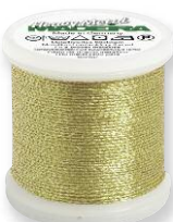
Heavy Metal No. 12 6 Farben in 50 m 50% Polyester 50% metallis. Polyester