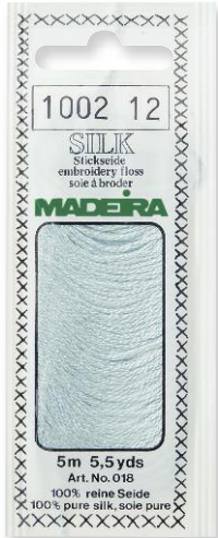
Silk 108 Farben in 5 m