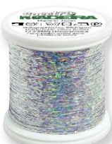
Spectra 6 Farben in 100 m

Das erste koch- und chlorechte Effekt-Handstickgarn. Ideal geeignet zum Besticken von Tischdecken, Servietten oder weiteren Textilien, die häufig gewaschen werden.