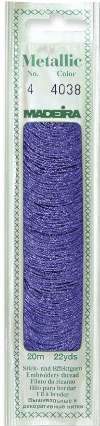
Metallic Mouline No. 4 24 Farben in 20 m 60% Viskose 40% metallis. Polyester