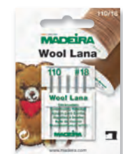
Art. No. 9452