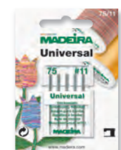
Art. No. 9450